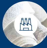
Lieferanten der Stufe 1

Das Verständnis dieser Stufen hilft dabei, die gesamte Lieferkette darzustellen und potenzielle Risiken und Chancen auf jeder Ebene zu identifizieren.