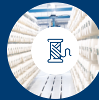
Lieferanten der Stufe 2