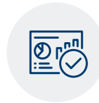
Funktionen und Leistung Ihrer Technologieplattform