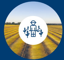
Lieferanten der Stufe 3