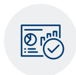
Recursos e capacidade da sua plataforma tecnológica