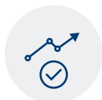
Disponibilidade e qualidade dos dados

Os fatores que podem influenciar o tempo necessário para mapear uma cadeia de abastecimento incluem: