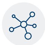
Complexidade da sua cadeia de abastecimento