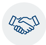
A experiência do seu parceiro