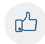
Comprometimento de equipes internas e partes interessadas da cadeia de abastecimento

Em resumo, embora seja difícil fornecer um prazo preciso, mapear uma cadeia de abastecimento é normalmente demorado e requer planeamento, coordenação e análise cuidadosos. Nossa recomendação? Entre em contato com a OPTEL hoje mesmo . Nossos especialistas podem ajudá-lo a obter maior clareza quanto à extensão do seu projeto de mapeamento da cadeia de abastecimento e ao cronograma potencial.