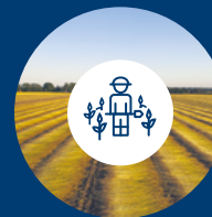
Fornecedores de nível 3