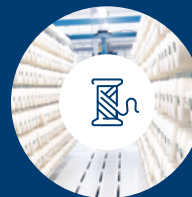
Fornecedores de nível 2